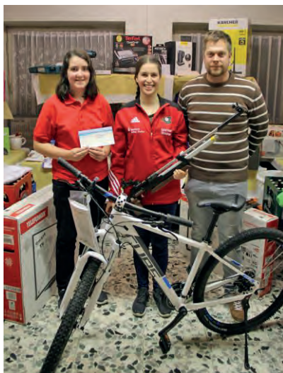
Die Gewinner der ersten 3 Preise 2019

gesponsort von der VR-Bank Taufkirchen-Dorfen und der Firma Holme Erding